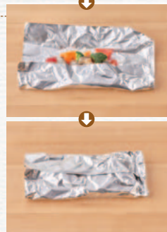
アルミホイルの上下を折りたたみ、両はしもきっちりと折り返す。