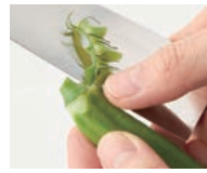
オクラはへたと実の間のがくを一周むくと、へたと食べられますよ。